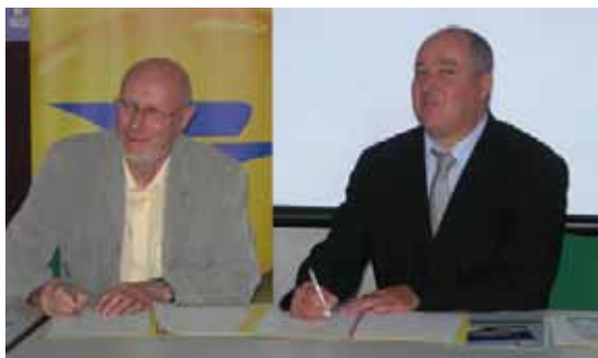
DOTC Loire Drôme Ardèche