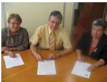
Centre Financier BORDEAUX

Déclinaison de la Convention Nationale entre La Poste et l'AFEH, trois nouvelles et récentes conventions de partenariat avec le Centre Financier de Bordeaux, la DOTC Loire Drôme Ardèche, la DOTC Auvergne et une prochaine envisagée avec l'Enseigne démontrent si besoin toute l'importance de faire vivre concrètement la politique d'action sociale votée au plan national.