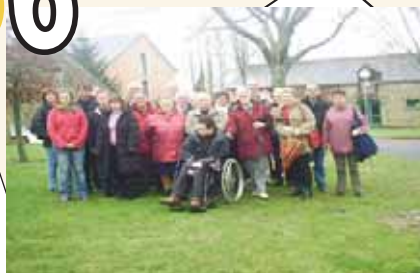
Assemblée Générale Morbihan