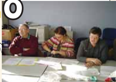
Assemblée Générale Eure et Loir