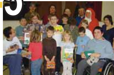
Arbre de Noël Loiret