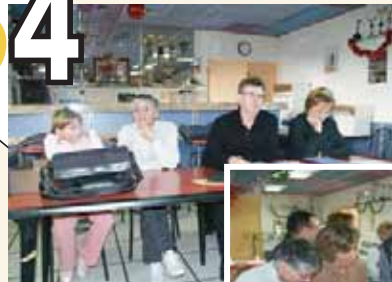
Assemblée Générale Hérault