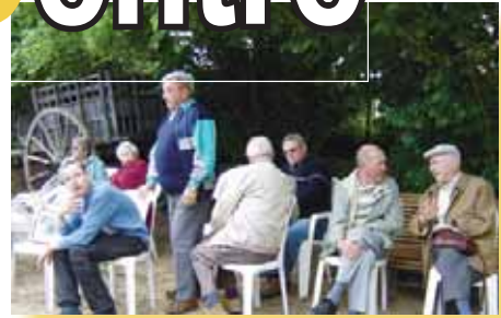
Sortie Région Centre