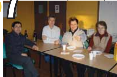
Assemblée Générale Indre et Loire