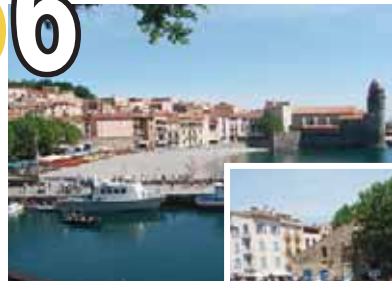
Sortie Pyrénées Orientales