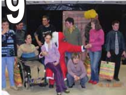
Assemblée Générale Corrèze