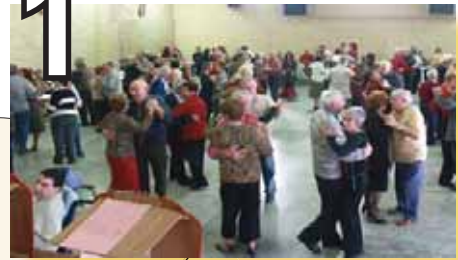
Assemblée Générale de l'Aude