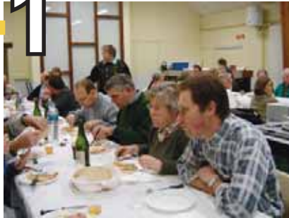
Soirée Crêpes Loir et Cher